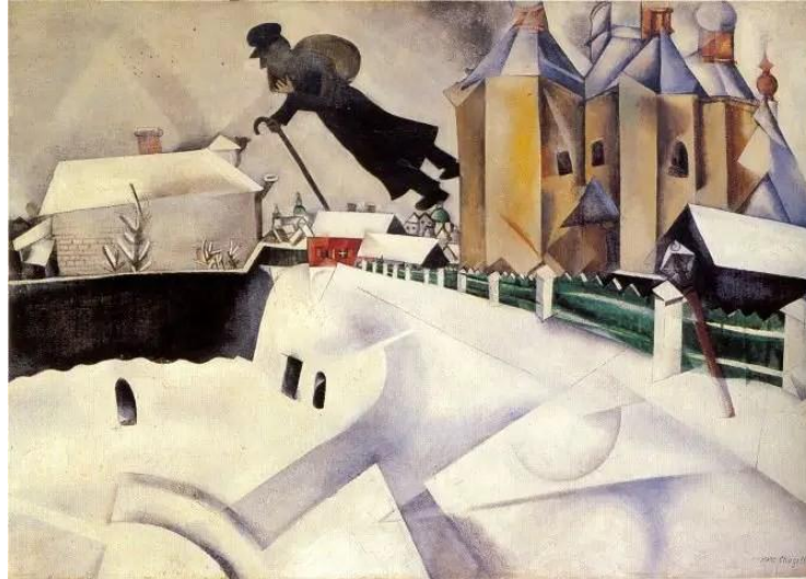
Marc Chagall, Su Vitebsk, 1984, olio su tela, 73×93 cm, Art Gallery of Ontario, Toronto

Via Ferrucci 25- NOSL010001, Sala danza Viale Ferrucci 27 e Sala Casorati della sede centrale