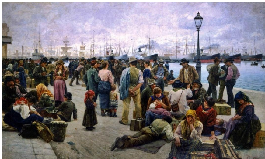
Angiolo Tommasi (1858-1923), nel dipinto “Gli emigranti”

Il pittore Angiolo Tommasi, nel dipinto “Gli emigranti “mostra un porto gremito di povera gente che attende di imbarcarsi per il Nuovo Mondo. Vediamo giovani, vecchi, bambini, donne incinte o che allattano. Con loro, pochi bagagli. I volti sono tristi e magri, scavati dalla fame e segnati da una dura vita di lavoro. Molti voltano le spalle al mare, come a voler ignorare quel futuro incerto che li attende...