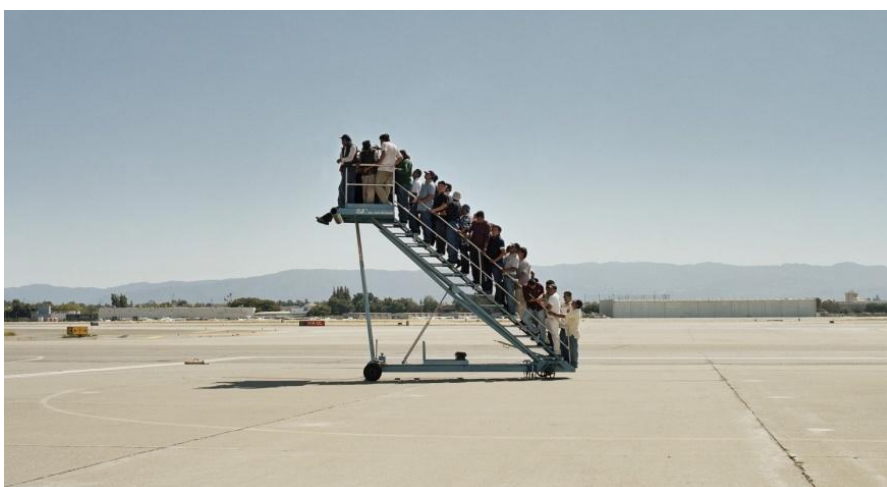
Adrian Paci, Centro di permanenza temporanea , 2007. Fotografia da video-installazione.

Via Ferrucci 25- NOSL010001, Sala danza Viale Ferrucci 27 e Sala Casorati della sede centrale