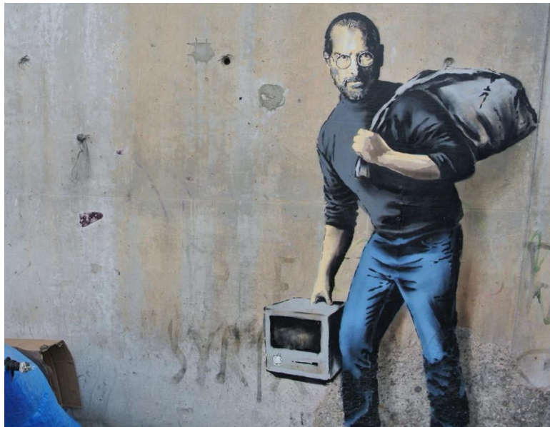
Banksy, Steve Jobs , 2015. Calais, muro del campo profughi

Banksy, lo street artist più famoso dei nostri giorni, ha spesso dedicato i suoi stencil murali alla questione migranti, con immagini spiazzanti e provocatorie. Ha dipinto Steve Jobs, ideatore della Apple, su un muro del campo profughi a Calais, in Francia, dichiarando: «Siamo portati a pensare che l'immigrazione drena le risorse di un Paese e invece Steve Jobs era il figlio di un migrante siriano». Apple è l'azienda con più profitti al mondo, paga circa sette miliardi di dollari all'anno di tasse ed esiste unicamente perché hanno accolto un giovane uomo da Homs».